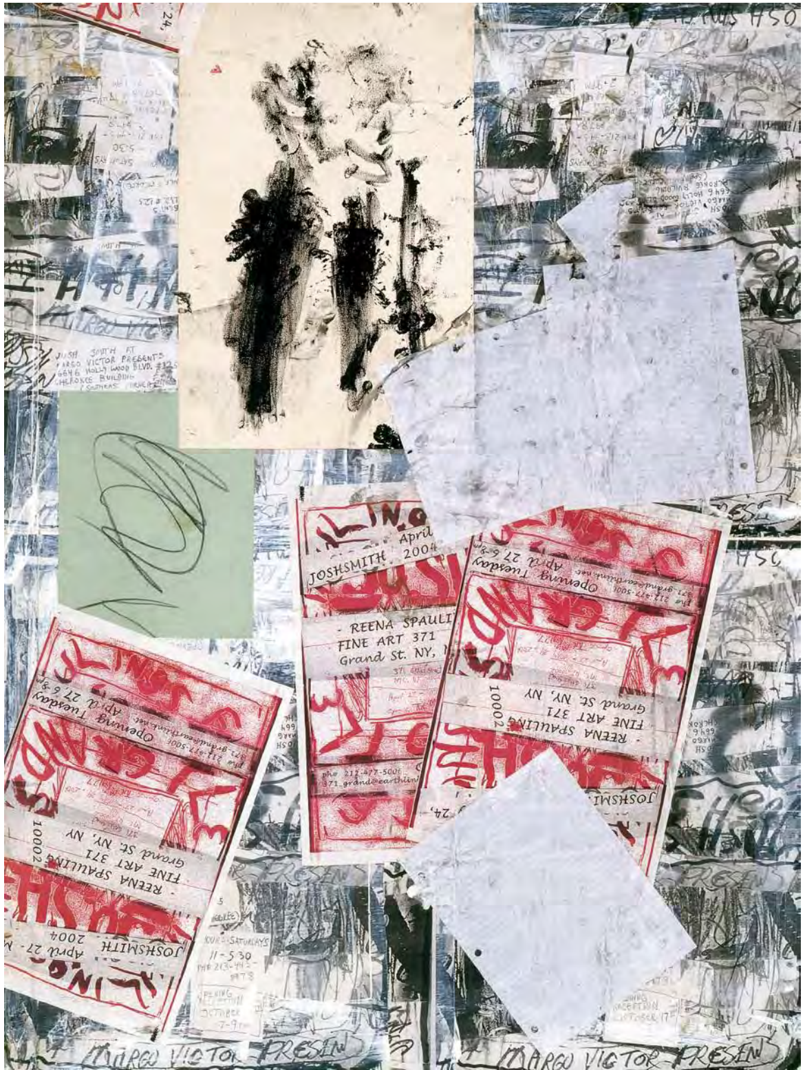
JOSH SMITH, UNTITLED, 2008, mixed media on panel, 48 x 36" / OHNE TITEL, verschiedene Materialien auf Tafel, 121,9 x 91,5 cm.