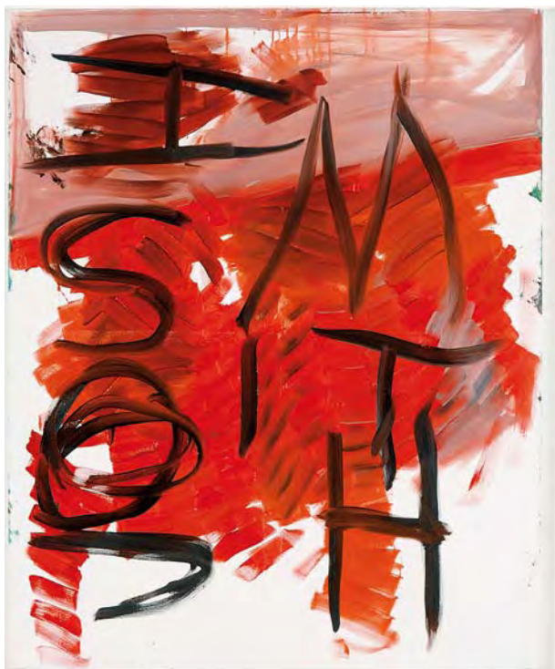
JOSH SMITH, UNTITLED, 2006, oil on canvas, 60 x 48" / OHNE TITEL, Öl auf Leinwand, 152,4 x 121,9 cm.

entstanden waren, wurde teils als zynischer Akt, teils als Kritik am Kunstmarkt aufgefasst. Zu einem Zeitpunkt, als seine Arbeiten an der Seite von Künstlern wie Wool und Oehlen, mit denen er oft in Verbindung gesetzt wurde, Einzug in eine grosse Galerie hielt, ging es Smith meines Erachtens darum, den Unterschied zwischen seiner und ihrer Malweise hervorzuheben. Der Ausstellungstitel «Abstraction» zeigt zudem seinen Überdruß mit Malern der 80er-Jahre in Verbindung gebracht zu werden. Sämtliche Arbeiten hatten dasselbe Format und wiesen eine viel bescheidenere Grösse auf als die von Wool und Oehlen. Zu ihnen gehörten die sogenannten Palette Paintings , auf denen Smith beim Malen anderer Bilder seine Pinsel abstreift. In dieser Serie finden die «gestalteten» Bilder ihre formlose, unartikulierte Spiegelung. In Verbindung mit der Neuinstallation der Ausstellung zeigen die bescheidenen Formate und die verunsichernde Wirkung der Paletten , dass es Smith nicht darum geht, autonome «Meisterwerke» zu schaffen, vielmehr soll jedes Element ein wenig von der es beseelenden schöpferischen Spannung